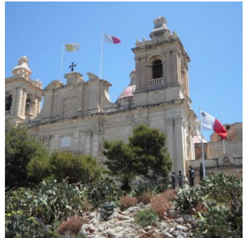
St. Lawrence Kirche

Die Tage stehen Ihnen zur freien Verfügung. (F A)