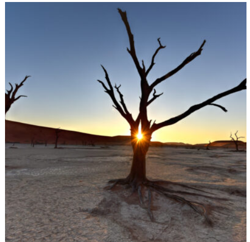
Sonnenaufgang am Dead Vlei

Früh am Morgen brechen Sie auf, um den Nationalpark zu erkunden und die Dünen im besten Licht zu erleben. Die einzigartige Lichtstimmung bei Sonnenaufgang begleitet Sie durch die Dünenlandschaft, vorbei an den imposanten 500 Jahre alten abgestorbenen Akazien im Dead Vlei bis zum Dünenkamm, dessen höchster Gipfel 350 Meter in die Höhe ragt. Ihr Frühstück wird als Picknick am Fuße der Dünen serviert, damit Sie gestärkt sind für das Abenteuer, das Ihnen bevorsteht. Nach dieser unvergesslichen Erfahrung besuchen Sie den Sesriem-Canyon, der sich über zwei Millionen Jahre hinweg durch das Sedimentgestein gebildet hat, während der Trockenfluss Tsauchab sein Bett tief in die Landschaft gegraben hat. (F A)