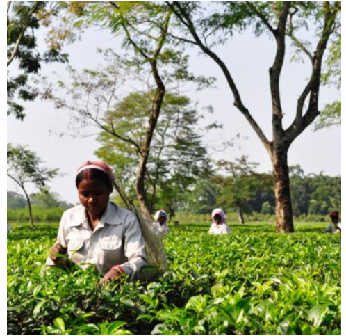
Teeernte in Assam, Indien

Lassen Sie sich von dem beeindruckenden Bau aus Marmor und rotem Sandstein verzaubern, der die Grabstätte des Mogulherrschers Nasiruddin Muhammad Humayun beherbergt. (F A)