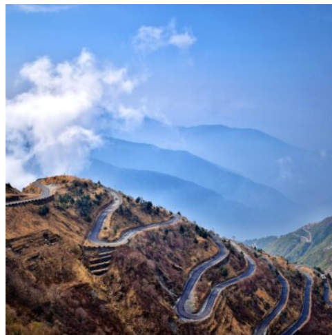
Zickzackstraße in Zuluk, Sikkim - Indien

Im Licht der Dämmerung fahren Sie hinauf auf den Tiger Hill. Aus 2.590 m Höhe bietet sich von hier ein spektakulärer Ausblick auf die schneebedeckten Gipfel des Himalayas. Werden Sie Zeuge, wie die aufgehende Sonne den gewaltigen Kangchendzönga und den fantastischen Mount Everest in der Ferne in rotgoldenes Licht taucht, und spüren Sie die einzigartige Atmosphäre dieser unvergleichlichen Naturlandschaft hautnah. Zurück in Ihrem Hotel genießen Sie ein gemütliches Frühstück. Bei einem Besuch in Darjeeling darf eine Fahrt mit einem der sogenannten Toy Trains der Darjeeling Himalayan Railway nicht fehlen. Der Schmalspur-Zug, der von der UNESCO zum Kulturerbe erklärt wurde, fährt noch immer mit der Original-Dampflokomotive. Ein Besuch des Ghoom-Klosters entführt Sie anschließend noch einmal in die religiösen Traditionen des Buddhismus. Prachtvolle Verzierungen und Malereien und zahlreiche Statuen machen es zum berühmtesten Kloster Darjeelings. (F A)