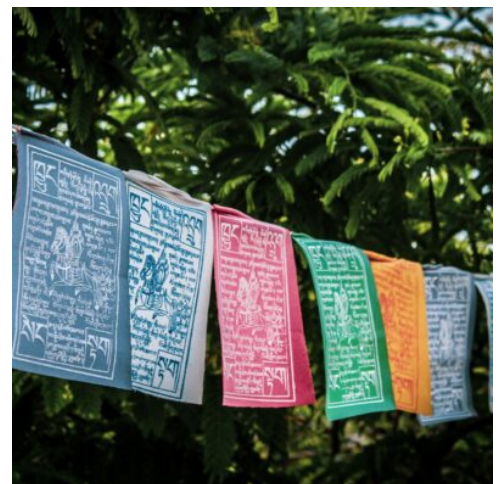
Gebetsfahnen, Sikkim, Indien

Nicht weit von der Stadt entfernt entführt Sie das buddhistisch-tibetische Kloster Zang Dhok Palri Phodang am heutigen Vormittag in die religiöse Tradition des Landes. Lassen Sie sich von den schönen Wandmalereien im Inneren der Gebetsräume bezaubern. Die nahe Tharpa Choling Gompa erinnert an den Orden der Gelupka, und die Wurzeln des nahegelegenen bhutanischen Klosters Thongsa reichen bis ins 17. Jahrhundert zurück. Nach diesen Impressionen führt Sie Ihre Reise in Richtung Nordosten in die buddhistische Pilgerstadt Gangtok. Die Hauptstadt von Sikkim begeistert mit ihrer schönen Lage auf einem Bergrücken, von wo sich wundervolle Ausblicke auf den Fluss Ranipool und den Gipfel des Bergs Kangchendzönga präsentieren. (F A)