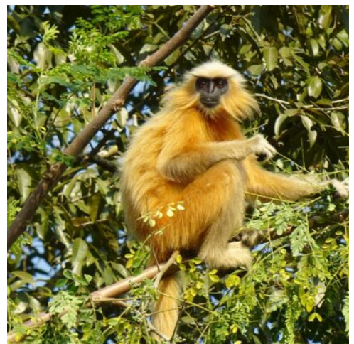
Goldlangur, Assam, Indien

Der heutige Tag hält spannende Jeep-Safaris durch den Nationalpark für Sie bereit. Beobachten Sie, wie die Natur in der Morgendämmerung langsam erwacht, wie Elefantenherden durch das grüne Buschland streifen und sich Wasserbüffel in den ruhigen Flussarmen erfrischen. Barasingha-Hirsche grasen an den Ufern der Seen, Faultiere schlummern in den Baumkronen und Affen toben durch das Geäst. Vielleicht entdecken Sie im hohen Gras sogar einen Tiger auf Pirsch. (F M A)