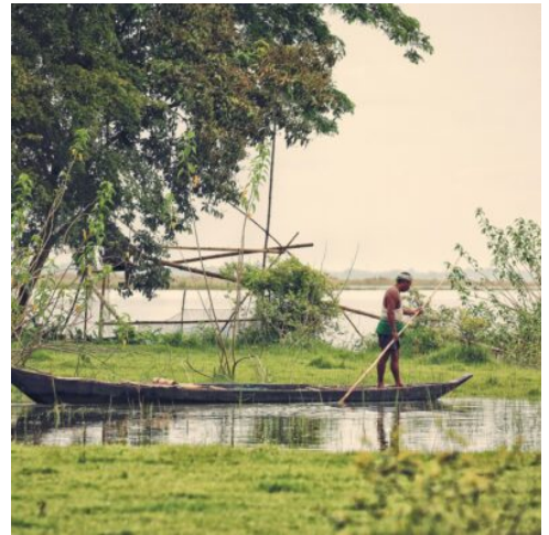
Brahmaputra-Fluss in Indien

Genießen Sie am Vormittag noch einmal eine Safari durch die wundervolle Landschaft, ehe Sie nach dem Mittagessen zurück nach Guwahati fahren. Zwischen Brahmaputra und dem Plateau von Shillong gelegen, bezaubert Guwahati als größte Stadt Assams. Nutzen Sie den Rest des Tages und erkunden Sie die Stadt auf eigene Faust. Unternehmen Sie einen Spaziergang am Ufer des Brahmaputra, erkunden Sie die Tempel der Stadt oder lassen Sie sich von der einzigartigen Atmosphäre der lokalen Märkte bezaubern. (F M)