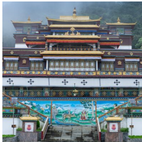
Ranka Kloster, Gangtok, Sikkim, Indien

Heute endet Ihre wundervolle Reise durch den Norden Indiens. Mit zahlreichen neuen Erinnerungen im Gepäck treten Sie Ihren Heimflug nach Deutschland an. (F)