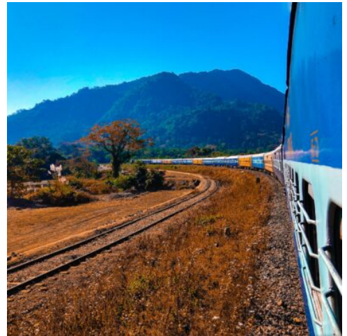
Eisenbahnfahrt, Assam, Indien

Über schmale Bergpässe und durch dichten Regenwald führt Sie Ihr Weg weiter nach Norden. Tauchen Sie beim Besuch einer Teeplantage in die Herstellung des berühmten „Darjeeling“-Tees ein, dessen Anbau die ländlichen Regionen Sikkims prägt. In Pelling angelangt besuchen Sie das Kloster Sang Choling. Aus dem 17. Jahrhundert stammt das schöne Gebäude, das als wichtige Pilgerstätte des Buddhismus zahlreiche Gemälde und Statuen aus dem 17. Jahrhundert beherbergt. Lassen Sie den Tag bei einem gemütlichen Abendessen ausklingen. (F A)