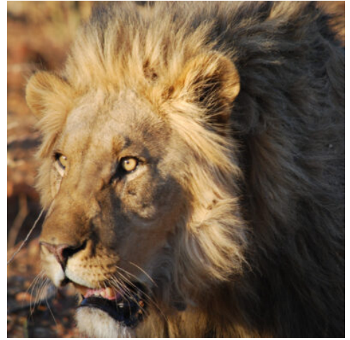
Löwe im Okonjima Natur-Reservat in Otjiwarongo, Namibia

Wer früh aufsteht, sieht vielleicht, wie eine Elefantenherde im Schein der aufgehenden Sonne durch die seichten Fluten des Kwando auf die andere Seite des Flusses zieht, fort aus dem Caprivistreifen und in den Chobe-Nationalpark, wohin auch Sie Ihre Reise als nächstes führt. Lassen Sie sich auf der Fahrt nach Botswana von der ursprünglichen Tropenlandschaft der regenreichsten Region Namibias verzaubern und bereiten Sie sich darauf vor, eines der faszinierendsten Wildschutzgebiete Afrikas zu entdecken. In Kasane, wo Namibia, Botswana, Sambia und Simbabwe aufeinandertreffen, beziehen Sie Ihre Lodge. Am Nachmittag erwartet Sie bereits ein weiteres Naturerlebnis. Bei einer Bootsfahrt erkunden Sie das Treiben auf dem Fluss noch einmal aus nächster Nähe. Halten Sie die Augen nach Krokodilen offen, die verborgen im seichten Wasser lauern, sehen Sie Nashörnern und Büffeln beim Trinken zu und vielleicht entdecken Sie auch ein Löwenrudel, das sich in der warmen Nachmittagssonne am Ufer niedergelassen hat. Genießen Sie bei einem kühlen Getränk an Bord den Sonnenuntergang über dem Fluss und beobachten Sie, wie in der Dämmerung langsam das nächtliche Leben am Fluss erwacht. (F)