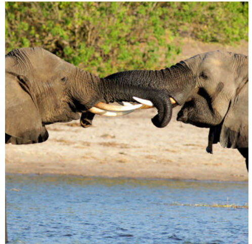
Elefanten im Kasane Nationalpark, Botswana

Im Nord-Osten Namibias erwartet Sie ein grünes Paradies. Hier, auf dem schmalen namibischen Streifen zwischen Sambia und Botswana, lockt die wasserreichste Region Namibias mit zahlreichen Flüssen und tropischem Savannenwald. Halten Sie Ausschau nach Antilopen, Gnus oder anderen Wildtieren, während Sie durch das wilde Buschland des Mahango-Nationalparks fahren, ein kleiner Teil des Bwabwata-Nationalparks, das mit seinem beeindruckenden Artenreichtum bezaubert. Mit jeder Kurve wird die Natur an den Seiten der Straße fruchtbarer, die Buschlandschaft wird zu ursprünglichem Tropenwald, der Boden zunehmend feuchter. Mit etwas Glück entdecken Sie heute schon grasende Zebras oder Giraffen, und vielleicht sehen Sie sogar einen Reiher, der am Ufer eines seichten Flusses auf Fische lauert. Im Herzen dieser sagenhaften Natur erwartet Sie Ihre Lodge. Entspannen Sie sich ein wenig im Garten oder auf der Terrasse und genießen Sie die Klänge der afrikanischen Wildnis. (F)