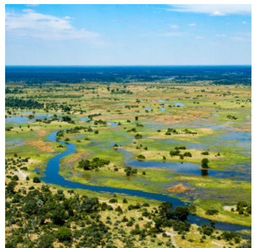
Der Okavango Delta, Botswana

Auch der heutige Tag steht ganz im Sinne der Tierwelt. Entlang der Salzpfanne Etosha geht es durch ständig wechselnde Vegetationszonen in den zentralen Teil des Parks, wo natürliche Wasserstellen Elefanten, Zebras, Antilopen, seltene Spitzmaulnashörner und viele weitere Tiere anlocken. Gnuherden ziehen durch die Savanne, Flamingos stehen zwischen den Tieren in den Wasserlöchern und mit etwas Glück entdecken Sie vielleicht sogar einen Löwen oder Geparden auf Pirsch. Wagen Sie sich dicht an die Wasserlöcher heran und beobachten Sie aus nächster Nähe, wie die Tiere miteinander interagieren, sich erfrischen und im Wasser spielen. Am Nachmittag kehren Sie in Ihre Lodge zurück. Genießen Sie bei einem kühlen Getränk die Stille des Reservats und sehen Sie zu, wie sich die Sonne langsam dem Horizont nähert. (F)