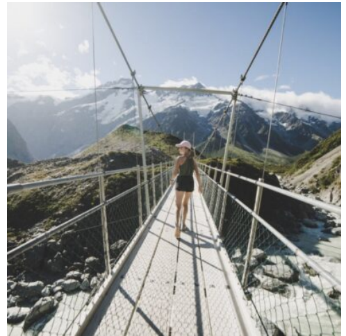
Hooker Valley Track, Mount Cook

Nach einem kurzen Umsteigeaufenthalt in Singapur geht die Reise weiter nach Christchurch.