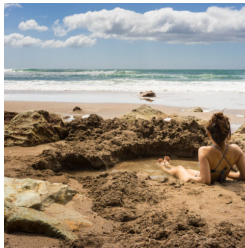
Hot Water Beach

Ihre Reise führt Sie von Kaiteriteri nach Picton, eingebettet in die reizvolle Marlborough-Region mit Weinbergen und Küstenpanoramen. Von dort aus können Sie die Fährüberfahrt (nicht im Preis inklusive) durch die malerischen Marlborough Sounds nach Wellington genießen. In Wellington angekommen, erwartet Sie die lebendige Hauptstadt Neuseelands mit ihrem kulturellen Angebot und charmanten Cafés am Wasser.