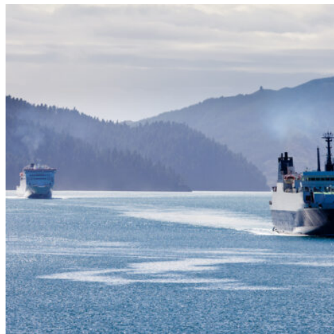
Fährfahrt durch die Marlborough Sounds

Sie setzen Ihre Reise von Te Anau nach Queenstown fort. Die Fahrt führt Sie durch abwechslungsreiche Landschaften mit weiten Tälern, klaren Seen und beeindruckenden Bergkulissen. In Queenstown angekommen, erwartet Sie eine lebendige Atmosphäre sowie zahlreiche Möglichkeiten für Aktivitäten oder entspannte Stunden am Lake Wakatipu.