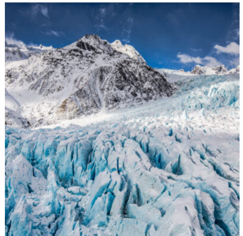
Franz Josef Gletscher

Nach der Rückkehr von Ihrer Cruise fahren Sie weiter nach Wanaka. Diese charmante Stadt ist ein wahres Paradies für Naturliebhaber und Abenteuerer. Ob Wanderungen, Bootstouren oder einfach nur Entspannen am See – Wanaka bietet für jeden Geschmack das Richtige. (F)