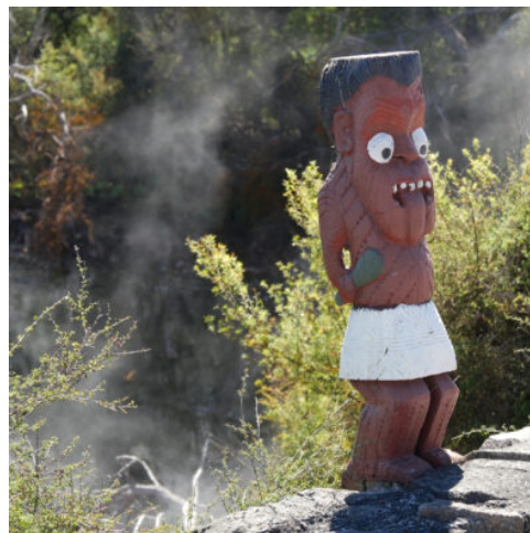
Maori Skulptur in Rotorua

Nach dem Frühstück werden Sie von den Maori als Freunde verabschiedet. Auf dem Weg zu den Bay of Islands unterbrechen Sie den langen Fahrtag für einen Besuch des Botanischen Gartens in Auckland. Über die Harbour Bridge erreichen Sie den subtropischen Norden. (F)