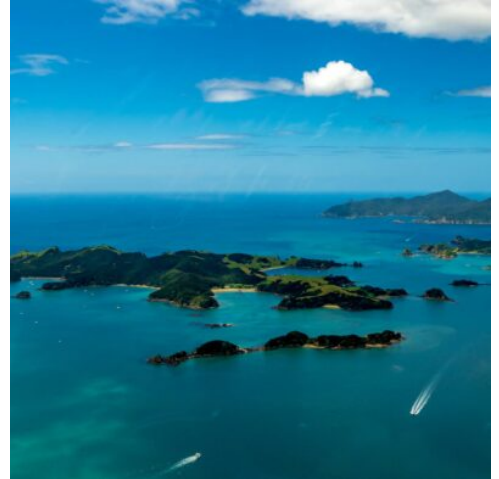
Bay of Islands

Der Tag steht Ihnen zur freien Verfügung. Besuchen Sie das historische Russell oder genießen Sie einfach die Ruhe und Schönheit der Bay of Islands. Unternehmen Sie einen Ausflug zu den berühmten Waitangi Treaty Grounds, dem Ort, an dem der Vertrag zwischen den Maori und den Briten unterzeichnet wurde (optional buchbar). (F)