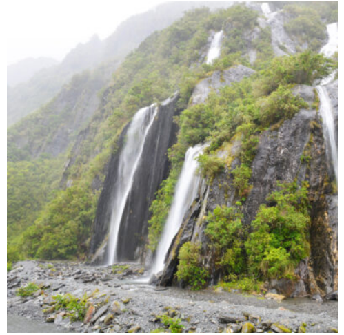
Franz Josef Wasserfall

Heute erleben Sie eine beeindruckende Fahrt durch die Schlucht des Buller River zur Westküste. Am Cape Foulwind erwartet Sie ein Spaziergang zu einer großen Robbenkolonie. Von hier aus geht es weiter entlang der wilden West Coast in Richtung Süden. In Punakaiki hat die tosende Brandung der Tasmanischen See die berühmten Pancake Rocks aus Kalkstein geformt. Diese Steilfelsen sehen aus wie riesige gestapelte Pfannkuchen und können einen mit spritzigen Wasserfontänen überraschen, wenn man nicht aufpasst. (F A)