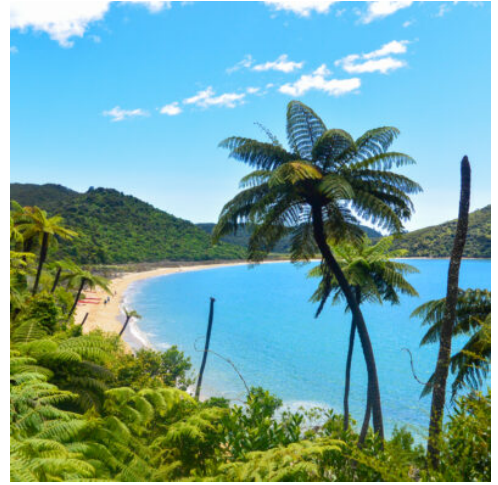
Abel Tasman Nationalpark

Ihre Reise führt Sie weiter in das Gebirge des Tongariro Nationalparks. In Ohakune, bekannt für seine atemberaubende Berglandschaft, verbringen Sie die nächsten zwei Nächte. Hier können Sie die frische Bergluft genießen und sich auf das Abenteuer des nächsten Tages vorbereiten. (F)