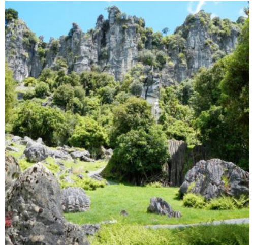
Hairy Feet Waitomo

Herzlich Willkommen in Neuseeland. Sie beginnen Ihre Reise in Auckland und übernehmen nach Ihrer Ankunft den Mietwagen. Verbringen Sie den restlichen Tag mit der Erkundung dieser lebendigen Stadt.