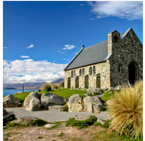
Church of the Good Shepherd am Lake Tekapo

Willkommen in Neuseeland. Nehmen Sie Ihren Mietwagen am Flughafen in Empfang und erkunden Sie das beschauliche Christchurch.