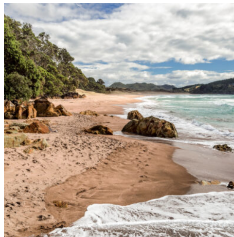
Hot Water Beach

Sie verlassen Wellington und fahren die Kapiti-Küste hinauf in das vulkanische Herz der Nordinsel zum Tongariro-Nationalpark. Er beherbergt drei aktive Vulkane, eingebettet in majestätische Landschaften. (F)