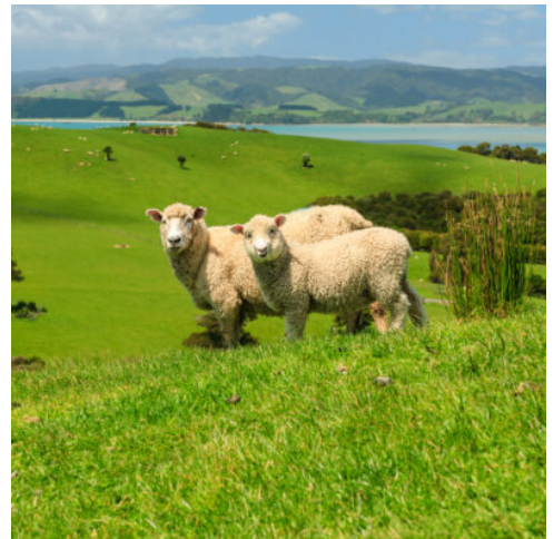
Landschaft in Neuseeland

Erkunden Sie die Hauptstadt Neuseelands heute auf eigene Faust. Im Stadtzentrum befinden sich zahlreiche Geschäfte, Cafés und Restaurants. Weitere Höhepunkte sind das Te Papa Tongarewa Nationalmuseum, der Botanische Garten und Oriental Bay. (F)