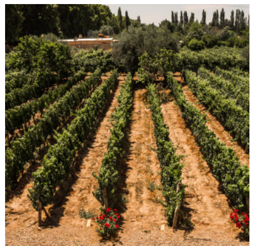
Valle de Uco

Von Buenos Aires aus fliegen Sie heute in den Südwesten Argentiniens, wo Sie am Fuße der Anden die Stadt Mendoza erwartet. Zahlreiche Winzereien, Weinhänge und Kellereien prägen die Region, die für Ihre exquisiten Rotweine bekannt ist. Weitläufige Alleen und Art-déco-Architektur prägen die Stadt, die mit ihren kleinen Geschäften und zahlreichen Parks zu Spaziergängen einlädt. Suchen Sie sich auf dem Plaza Independencia eine Bank im Schatten der Bäume und tauchen Sie in das entspannte Flair Mendozas ein. Etwas außerhalb der Stadt bietet der kleine Berg Cerro de la Gloria einen fantastischen Ausblick über die Dächer der Stadt. (F)