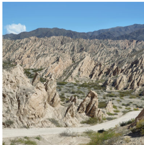
Quebrada de la Flechas

Folgen Sie dem Rio Calchaqui in die spektakuläre Quebrada de las Flechas. Schroffe Felsformationen und zerklüftete Steinwände vereinen sich zu einer verwunschen wirkenden Landschaft, durch welche sich die kurvige Straße windet und immer wieder fantastische Panoramablicke gewährt. Anschließend lockt der Nationalpark Los Cardones mit beeindruckenden Kandelaberkakteen, die bis zu 12 m in die Höhe ragen. Genießen Sie den Ausblick und vielleicht entdecken Sie sogar eine Vicuña-Herde, die durch die ursprüngliche Andenlandschaft zieht. Zurück in Salta erwartet Sie ein köstliches Abendessen. (F A)