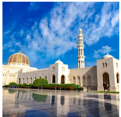
Sultan Qaboos Moschee

Sie beginnen den Tag mit einer der wichtigsten Sehenswürdigkeiten Muscats, der Großen Sultan-Qabus-Moschee. Der mächtige Bau aus indischem Sandstein weiß nicht nur mit seiner schönen Architektur zu beeindrucken, sondern gewährt auch Nichtgläubigen Zutritt und bietet so einen einmaligen Einblick in die Welt des Islams (Kleiderordnung beachten). Ein prächtiger Swarovski Leuchter und ein riesiger handgeknüpfter persischer Teppich zieren die Hauptgebetschale. Weiter geht es zum Muttrah Souq, einem traditionellen orientalischen Bazar. Lassen Sie sich von der lebhaften Atmosphäre und dem Duft von Weihrauch und Gewürzen verzaubern. Anschließend Besuch des Bait Al Zubair Museums in der Altstadt Muscats. Das private Museum ist bekannt für seine feine Kollektion an traditionellem Schmuck, Waffen und Kleidung. Mittagessen in einem lokalen Restaurant. Weiter geht es zu einem Fotostopp am Al Alam Palace, dem Palast des Sultans. Anschließend genießen Sie bei einer ca. 2-stündigen Bootsfahrt entlang der Küste Muscats den Sonnenuntergang. Auf dem Rückweg zum Hotel halten Sie für einen Foto-Stopp am Royal Opera House und fahren durch das Regierungs- und Botschaftsviertel. (F M)