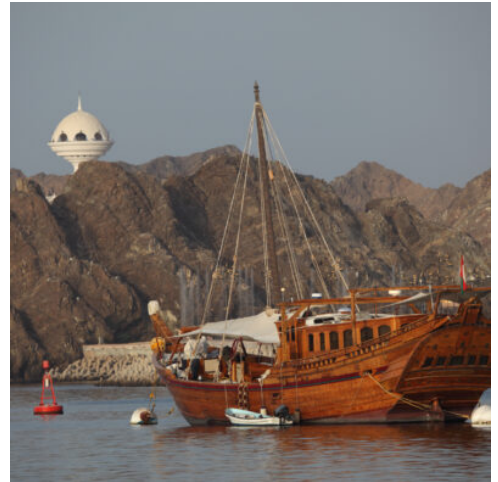
Schiff im Hafen von Muskat

Erholen Sie sich von Ihrer Anreise bevor sie die Möglichkeit haben in der nahe gelegenen Shopping-Mall auf eigene Faust einen ersten Einblick in den omanischen Alltag zu erleben. Zahlreiche Geschäfte und Boutiquen laden zum Einkaufserlebnis ein. Oder Sie schlendern entlang der Corniche, der Uferpromenade, und entdecken den Fischmarkt und den Hafengebiete nach Ihrem Gusto. Abendessen im Hotel. (F A)