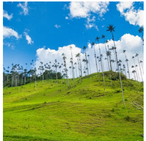
Wachspalmen im Cocora- Tal

Wundervolle Landschaften erwarten Sie im Cocora- Tal. Hoch erheben sich die Wachspalmen aus den dichten Nebelschwaden, die dem von hohen Bergen umrahmten Tal etwas Verwünschenes verleihen. Eine leichte Wanderung führt Sie bis an den Rand des Nebelwaldes. Anschließend begrüßt Sie das farbenfrohe Salento mit typischer Architektur und vielen kleinen Kunsthandwerksstätten. (F)