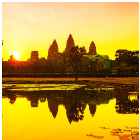
Angkor Wat, Kambodscha

Nach einer kurzen morgendlichen Kreuzfahrt entlang des Tonle Sap-Flusses steigen Sie in Prek Kdam aus und fahren mit dem Bus in die Stadt Oudong. Sie besuchen das Vipassana Dhura Meditationszentrum für einen Morgen der Entspannung und Meditation bevor Sie eine Fahrt durch die alte Hauptstadt unternehmen. Nach einem Mittagessen steigen Sie um in Ochsenkarren, um entlang des Tonle Sap-Flusses die bunten Dörfer, Märkte und Tempel zu besuchen. Am Abend wird eine Cocktailstunde um eine Feuerstelle in einem der lokalen Khmer-Dörfer veranstaltet, wo Sie mit den Dorfbewohnern Zeit verbringen und etwas über deren Kultur erfahren. (F M A)