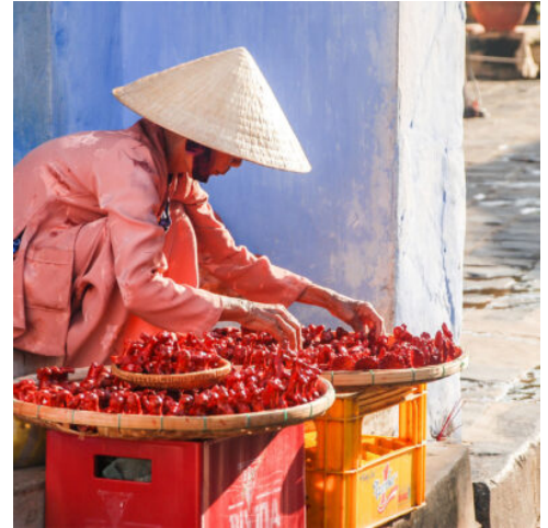
Marktszene in Hoi An, Vietnam

Bei Ihrer Landung in Saigon werden Sie bereits am Flughafen erwartet und zu Ihrem Hotel gefahren. Genießen Sie die Annehmlichkeiten Ihrer Unterkunft und stimmen Sie sich auf die kommenden Tage ein.