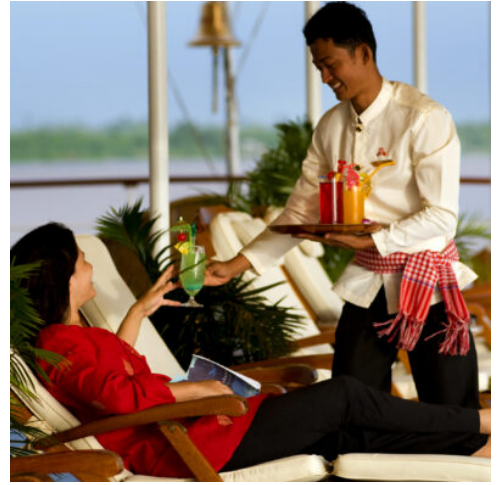
An Bord der RV Mekong Pandaw

Am Morgen segeln Sie durch das Delta und erhalten einen Einblick in das Leben der Bewohner entlang der mächtigsten Wasserstraße Südostasiens. Nach dem Mittagessen beginnt Ihr Ausflug mit einer kurzen Busfahrt durch die üppige Landschaft zur „grünen Oase“ von Gao Giong. Hier versammeln sich Wasservögel, die Sie mit einem Fernglas beobachten können. (F M A)