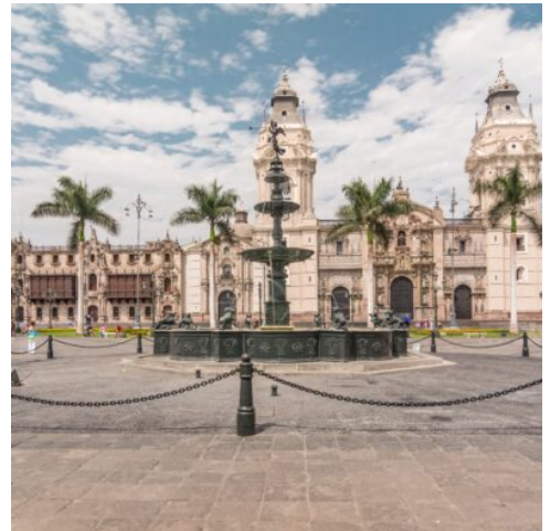
Plaza de Armas in Lima

Optional buchbar: Ein geführter Spaziergang durch das charmante Viertel Miraflores oder ein abendlicher Besuch des farbenfrohen Fontänenparks mit anschließendem Abendessen im stilvollen Café del Museo.