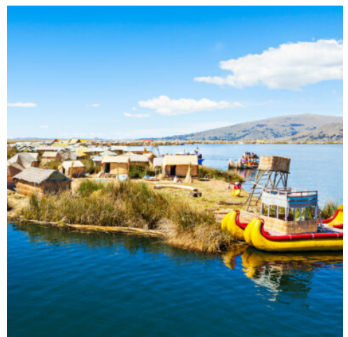
schwimmenden Schilfinseln der Uros

Nach dem Frühstück erkunden Sie die höchstgelegene Großstadt der Erde bei einer Stadtrundfahrt. Im Zentrum, auf ca. 3.600m Höhe, entdecken Sie viele gut erhaltene Kolonialbauten und einen bunten Indianermarkt. Im Anschluss verlassen Sie die Innenstadt und fahren durch die noblen Vororte in das Tal des Mondes im Tal des La Paz Flusses. Aus dem rötlichen und grauen Gestein haben Wind und Wetter über Millionen von Jahren eine Landschaft wie auf dem Mond geschaffen. (F)