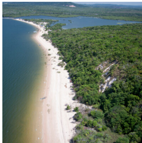
Alter do Chão

Am frühen Morgen geht es mit dem Flugzeug in die Hauptstadt des Bundesstaates Amazonas, Manaus. Hier werden Sie das Teatro Amazonas besichtigen. Es ist nicht nur ein Überbleibsel einer Zeit ungeheuren Wohlstandes, sondern geradezu ein Symbol und inzwischen Wahrzeichen der Stadt. Sie übernachten in Manaus im Hotel. (F)