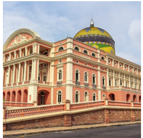
Teatro Amazonas in Manaus

Am Vormittag besuchen Sie eine Verarbeitungsanlage für Paranüsse, wo Sie einen Einblick in die Produktion dieser kostbaren Nüsse erhalten. Neben dem Gummi der Kautschukbäume und den tropischen Hölzern sind die Paranüsse eine wichtige Einnahmequelle für die einheimische Bevölkerung. Am Abend können Sie den Hauptplatz von Riberalta besuchen, wo das bunte Treiben der Einheimischen mit ihren kleinen Mofas und Motorrädern für Unterhaltung sorgt. (F)