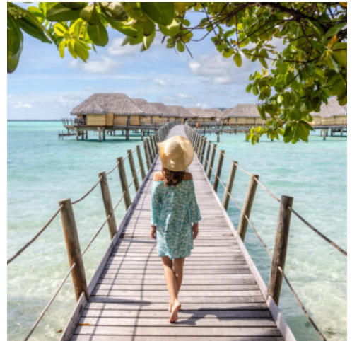
Hotel Le Taha'a by Pearl Resorts

Nach einem entspannten Transfer fliegen Sie weiter nach Raiatea, dem spirituellen Herzstück Französisch-Polynesiens. Von dort aus gleiten Sie mit einem privaten Boot durch glitzernde Lagunen zu Ihrem exklusiven Rückzugsort auf der zauberhaften Insel Taha'a. Gestalten Sie den restlichen Tag ganz nach Ihren Wünschen – ob beim Erholen in der traumhaften Kulisse, beim Schlendern durch die tropische Natur oder einfach beim Genießen der Ruhe und Exklusivität Ihres Resorts. Am Abend erwartet Sie ein exquisit abgestimmtes 3-Gänge-Menü im Hotel, das Ihren Tag stilvoll abrundet. (F, A)