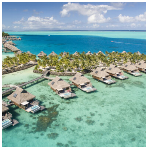
Hotel Conrad Bora Bora Nui

Genießen Sie einen entspannten Tag ganz nach Ihren Wünschen in Ihrem traumhaften Refugium, dem Le Tahaa by Pearl Resort. Tauchen Sie ein in die Ruhe und Schönheit dieses Inselparadieses und lassen Sie sich von den exklusiven Annehmlichkeiten verwöhnen – sei es beim Sonnenbaden am privaten Strand, einem wohltuenden Spa-Erlebnis oder einfach beim Genuss der atemberaubenden Aussicht auf die Lagune. Am Abend erwartet Sie ein stilvolles 3-Gänge-Menü im Hotelrestaurant, das Ihren Genuss perfekt abrundet. (F, A)