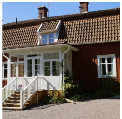
Geburtshaus von Astrid Lindgren

Heute erkunden Sie die Südküste Schwedens. Auf dem Weg nach Malmö machen Sie einen Halt in Mörrum am Laxenshus. Der nach dem Ort benannte Fluss mündet vier Kilometer südlich von Mörrum in die Pukavikbucht der Ostsee und ist einer der bekanntesten Lachsflüsse Schwedens. Weiter geht es über die schöne Küstenstadt Kivik und das Naturdenkmal „Die Steine von Ale“ nach Ystad. Am östlichen Ende der Einkaufsstraße wurde das Viertel Per Helsas gård mit seinen alten Fachwerkhäusern behutsam modernisiert. Hier liegen schöne Cafés und Geschäfte, die Kunsthandwerk verkaufen. Weiterfahrt zum Hotel nach Malmö am Öresund. (F)