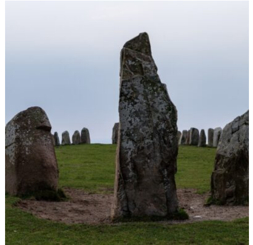
Die Steine von Ale

Sie fahren heute in die Metropole Göteborg, welche Sie auf einer 2-stündigen Stadtführung erleben. Schwedens zweitgrößte Stadt wurde 1621 von König Gustav II. Adolf gegründet und wuchs schnell zum Zentrum des kommerziellen Fischfangs und des Schiffbaus. Später spielte es eine führende Rolle in der innovativen Automobilindustrie, denn Göteborg ist die Heimat von Volvo. Sie sehen u.a. die bekannte Fischhalle, die Prachtstraße Avenyn und das gemütliche Künstlerviertel Haga. Im Zentrum finden Sie zahlreiche kleine befahrbare Kanäle und alte Bauwerke aus längst vergangener Zeit. Danach fahren Sie zu dem lieblichen Schloss Läckö, das bekannte Barockschloss des Grafen Magnus Gabriel de la Gardie am Ufer des Vårsees. Danach fahren Sie zum Hotel in Örebro. (F)