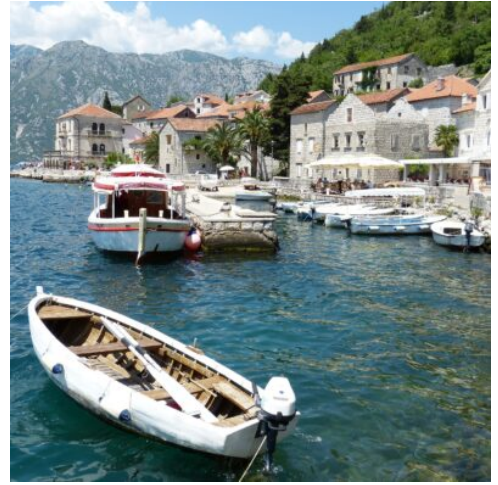
Bucht von Kotor

Heute startet der Tag mit der Fahrt in die Stadt Mostar, wo Sie im Rahmen einer Stadtbesichtigung auch die berühmte Brücke sehen werden. Der Ort galt als Verbindung zwischen Orient und Okzident, und das Symbol dieser Verbindung war die Stari Most, die alte Brücke. Nach der Zerstörung im Krieg wurde Sie 2010 wiedereröffnet und die „neue“ Brücke gilt als Symbol der Wiedervereinigung zwischen den Menschen. Danach geht es weiter in die bosnische Hauptstadt Sarajevo. Bei einer Stadtbesichtigung sehen Sie osmanische, sozialistische und moderne Bauwerke. Danach Bezug des Hotels und Abendessen. (F A)