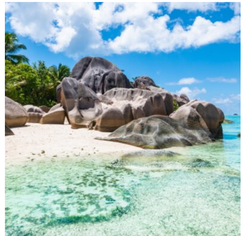
Anse Source d'Argent

Eine kurze Fährfahrt bringt Sie weiter nach La Digue, wo die Zeit stillzustehen scheint. Hier bewegt man sich am besten mit dem Fahrrad fort. Erkunden Sie die kleinen Straßen, treffen Sie auf freundliche Einheimische und entdecken Sie den legendären Strand Anse Source d'Argent mit seinen charakteristischen Granitfelsen. La Digue steht für Ruhe, Gelassenheit und das ursprüngliche Lebensgefühl der Seychellen. (F A)