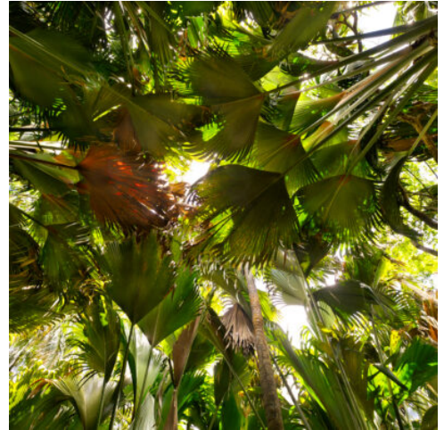
Vallée de Mai

Nach Ihrer Ankunft auf Mahé werden Sie am Flughafen herzlich begrüßt und zum Hafen gebracht. Mit der Fähre geht es weiter nach Praslin, der zweitgrößten Insel der Seychellen.