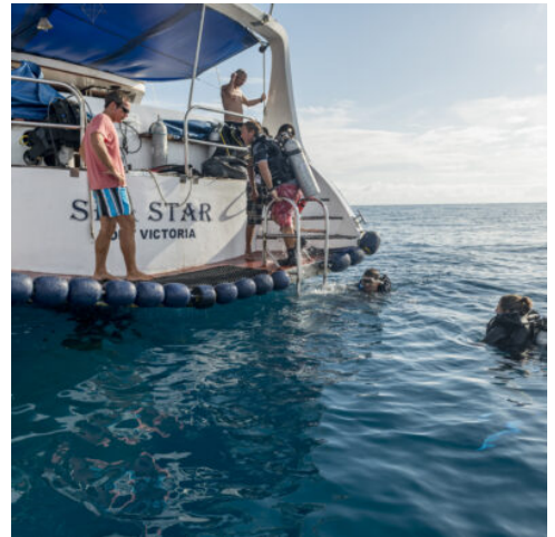
Schnorcheln auf den Seychellen

Nach Ihrer Ankunft auf Mahé werden Sie herzlich am Flughafen empfangen und zum Hafen gebracht, wo bereits Ihr Schiff auf Sie wartet. Nach der Einschiffung begrüßt Sie der Kapitän an Bord und informiert Sie über den Verlauf Ihrer Kreuzfahrt. Anschließend heißt es „Leinen los“: Entlang der traumhaften Küstenlinie umrundet das Schiff den nördlichen Teil Mahés. Sie passieren die berühmte Beau Vallon Bay und erleben die spektakuläre Nordwestküste mit ihren imposanten Granitformationen, tropischer Vegetation und dem leuchtend türkisblauen Wasser des Indischen Ozeans. Am Abend genießen Sie bei einem Grillabend an Bord erste kulinarische Eindrücke der kreolischen Küche und stimmen sich entspannt auf die kommenden Tage im Inselparadies ein. (M A)