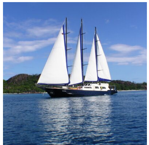
Sea Star unterwegs

Im Laufe des Tages geht es zurück nach Mahé. Über Nacht wird im Ste. Anne Marine Park geankert, der von einer Gruppe üppig bewachsener Granitinseln umgeben ist. (F M A)