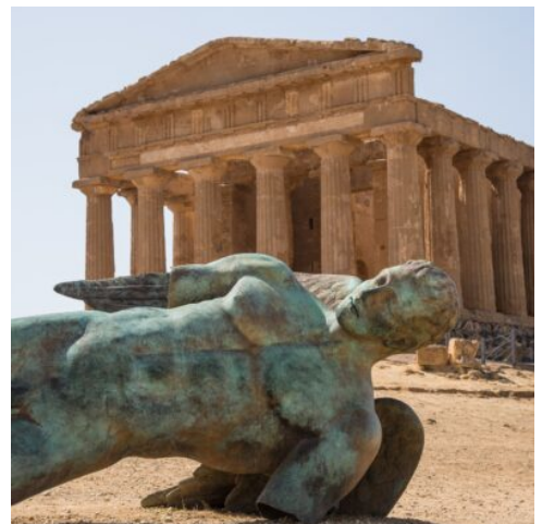
archäologischen Stätten von Agrigent

Frühstück im Hotel, Check-out, Fahrt nach Catania und Rückflug. (F)