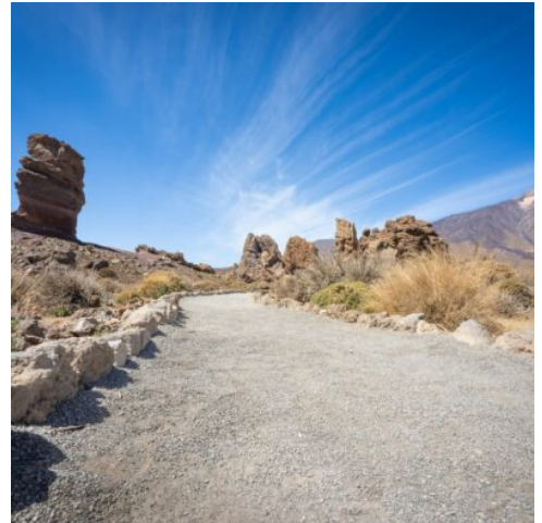
Roques de García am Teide

Starten Sie heute früh und erkunden den beeindruckenden Teide-Nationalpark, der zum UNESCO-Weltnaturerbe gehört. Erkunden Sie die bizarre Landschaft mit den markanten Felsformationen der Roques de García und genießen Sie die klare Bergluft. Optional können Sie mit der Seilbahn den Gipfel des Pico del Teide auf über 3.500 Metern Höhe erreichen – eine beeindruckende Aussicht erwartet Sie (wetterabhängig, Reservierung empfohlen). Fahren Sie am Nachmittag zurück nach Puerto de la Cruz, wo Sie am Strand Playa Jardín entspannen oder den Hotelpool nutzen können. (F)