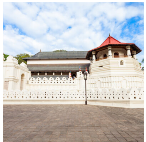
Zahntempel in Kandy

Am Morgen verlassen Sie das idyllische Hochland und fahren hinab in den Süden Sri Lankas nach Tissamaharama, dem Tor zum berühmten Yala-Nationalpark. Die abwechslungsreiche Fahrt führt Sie durch spektakuläre Landschaften, vorbei an kleinen Dörfern, weiten Feldern und tropischer Vegetation. Nach Ihrer Ankunft in Tissamaharama checken Sie im Hotel ein und haben etwas Zeit zur Erholung. Am Nachmittag beginnt eines der eindrucksvollsten Erlebnisse Ihrer Reise: eine private Jeep-Safari im Yala-Nationalpark. Dieses Naturparadies ist Sri Lankas beliebtester und artenreichster Nationalpark und ist bekannt für seine dichte Population an Leoparden, aber auch Heimat von Elefanten, Lippenbären, Krokodilen, Wildschweinen, Hirschen, Affen und zahlreichen Vogelarten. Mit etwas Glück erleben Sie diese majestätischen Tiere aus nächster Nähe. (F A)