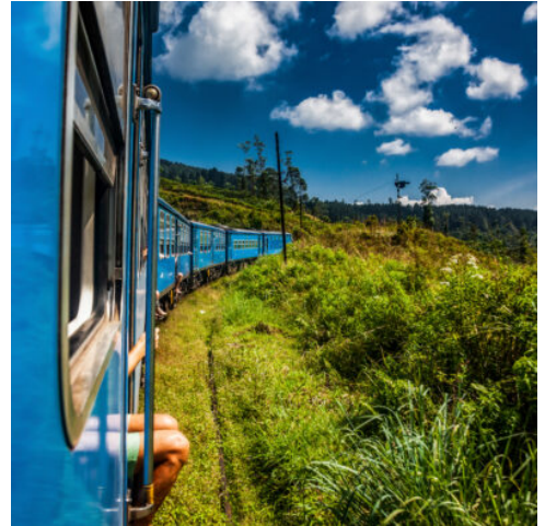
Zugfahrt nach Nanu Oya

Am letzten Tag Ihrer Reise erfolgt der Transfer vom Hotel in Beruwala zum Internationalen Flughafen in Colombo. Ihr Fahrer holt Sie pünktlich ab und bringt Sie entspannt zum Flughafen, damit Sie mindestens drei Stunden vor Ihrem Abflug eintreffen. Mit vielen unvergesslichen Eindrücken im Gepäck verabschieden Sie sich von Sri Lanka und treten die Heimreise an. (F)