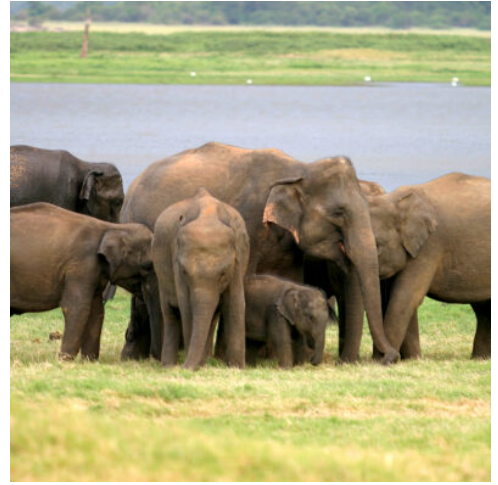
Elefanten im Minneriya-Nationalpark

Heute setzen Sie Ihre Reise in Sri Lanka Richtung Süden fort: Nach dem Frühstück brechen Sie auf nach Kandy, der letzten Königsstadt des Landes und einem spirituellen Zentrum des Buddhismus. Auf dem Weg dorthin legen Sie einen Halt im bekannten Gewürzgarten von Matale ein. Hier entdecken Sie die faszinierende Welt der sri-lankischen Gewürze, von Zimt über Kardamom bis hin zu Kurkuma. Erfahren Sie mehr über ihre traditionellen Anwendungen in Küche und Ayurveda. Als besonderes Extra erwartet Sie eine 10- bis 15-minütige ayurvedische Massage, die Körper und Geist entspannt und Ihnen neue Energie für den Tag schenkt. Anschließend Weiterfahrt nach Kandy. Nach dem Check-in im Hotel unternehmen Sie am Nachmittag einen gemütlichen Spaziergang entlang des malerischen Kandy-Sees, der mitten im Stadtzentrum liegt und eine ruhige, fast meditative Atmosphäre ausstrahlt. Ein Höhepunkt des Tages ist der Besuch des Zahntempels (Sri Dalada Maligawa) – einer der heiligsten Orte des Buddhismus. In diesem kunstvoll verzierten Tempel wird eine kostbare Reliquie verehrt: ein Zahn des historischen Buddha, der im 4. Jahrhundert n. Chr. nach Sri Lanka gebracht wurde. Im Anschluss erleben Sie Kandy bei einer kurzen Stadtrundfahrt, bevor Sie in einem landestypischen Tuk-Tuk stilvoll zum Hotel zurückkehren. (F A)