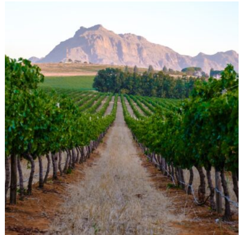
Weinberge bei Stellenbosch

Sie setzen Ihre Reise fort und fahren nach Oudtshoorn, die Straußenhauptstadt der Welt. Hier erwartet Sie eine faszinierende Mischung aus Geschichte, Kultur und Natur. Nach dem Check-In steht am Nachmittag der Besuch einer Straußenfarm auf dem Programm. Im Rahmen einer Führung erfahren Sie alles Wissenswerte über die Straußenzucht, von der Aufzucht der Küken bis zur Verarbeitung der wertvollen Straußenprodukte. Sie haben die Möglichkeit, diese beeindruckenden Vögel aus nächster Nähe zu beobachten und spannende Einblicke in das Leben auf der Farm zu gewinnen. (F)