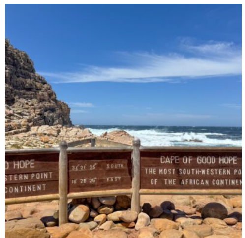
Kap der guten Hoffnung

Heute erwartet Sie ein beeindruckender Tagesausflug zum Kap der Guten Hoffnung auf der Kaphalbinsel. Das Kap an der südwestlichen Spitze Afrikas ist berühmt für die zahlreichen Schiffswracks, die hier im Laufe der Jahrhunderte geschehen sind, und für den dramatischen Punkt, an dem der Atlantische Ozean auf den Indischen Ozean trifft. Doch größtenteils werden Besucher von einer ruhigen See empfangen, die Ihnen kilometerweite Ausblicke ermöglicht. Die Tour führt Sie zunächst nach Simon's Town, wo Sie die faszinierende Pinguinkolonie am Boulders Beach besuchen können. Danach erleben Sie den malerischen Chapman's Peak Drive, der zu den schönsten Küstenstraßen der Welt zählt, und genießen die atemberaubende Aussicht entlang des Boyes Drive oberhalb der False Bay. (F)