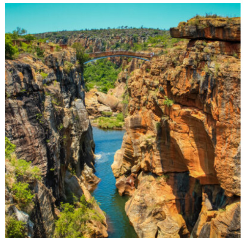
Bourke's Luck Potholes

Heute verlassen Sie Kapstadt und setzen Ihre Reise in Richtung Osten fort, durch das bergige Land über den Tradou-Pass, der mit seiner einzigartigen Schönheit rund um den Fluss Tradou besticht. Weite Steppen, wüstengleiche Landstriche, schroffe Felsformationen und raue Bergrücken aus hellem Stein vereinen sich zu wundervollen Landschaftspanoramen, die Ihnen die Weiterreise durch die Kleine Karoo bis in die beschauliche Stadt Oudtshoorn versüßen. Dort angekommen, hält der Tag noch weitere Erlebnisse für Sie bereit: Auf der Cango-Straußenfarm tauchen Sie nicht nur in die Tradition der Straußenzucht, sondern auch in die Geschichte der Region ein, in der die Zucht der großen Vögel lange Zeit die wichtigste Einkommensquelle war. (F A)