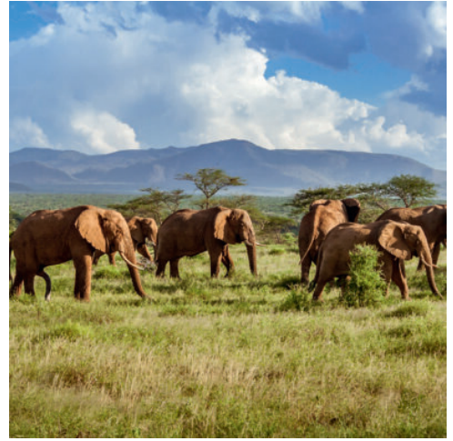
Elefantenherd im Krüger-Nationalpark

Zwischen Indischem Ozean und dem größten Waldgebiet Südafrikas gelegen, locken die Lagunenstadt Knysna und ihre Umgebung mit einer einzigartigen Flora und Fauna, die Sie bei Ihrem heutigen Ausflug entdecken. Lassen Sie sich bei einer Bootsfahrt auf der Lagune von der idyllischen Landschaft bezaubern, während Sie sich vorbei an kleinen Inseln den mächtigen Sandsteinklippen nähern, die die Lagune mit dem offenen Meer verbinden. Hier erwartet Sie das Featherbed-Naturreservat. Zahlreiche exotische Vogelarten haben zwischen zerklüfteten Felsformationen und im Geäst der verwachsenen Bäume ihre Nistplätze und gewähren einen faszinierenden Einblick in die afrikanische Tierwelt. Abgerundet wird der Ausflug durch ein köstliches Mittagessen. Genießen Sie die Geräusche der Natur und den Gesang der Vögel, ehe Sie über das tiefblaue Wasser zurück nach Knysna fahren. Nutzen Sie den Rest des Nachmittags doch zum Beispiel für einen Bummel durch die zahlreichen Geschäfte der Stadt. (F M A)