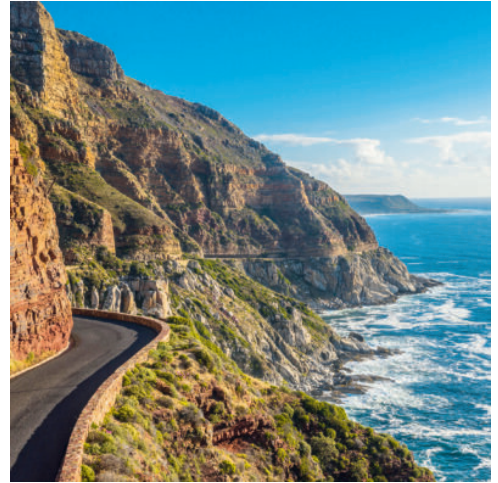
Chapman's Peak Drive

Bereits aus dem Flugzeug bietet die Hafenstadt Kapstadt zwischen dem blauen Meer und dem gewaltigen Tafelberg einen wundervollen Anblick, der Sie auf die kommende Reise einstimmt. Bei Ihrer Landung werden Sie bereits von Ihrer Reiseleitung erwartet und zu Ihrem Hotel gefahren. Gestalten Sie den Rest des Tages frei nach Ihren Wünschen. Erholen Sie sich in Ihrem Hotel, unternehmen Sie einen ersten Spaziergang auf eigene Faust durch die Straßen und erleben Sie die aufregende Vielfalt Kapstadts oder begeben Sie sich an den feinsandigen Strand, wo das Rauschen der Wellen zum Träumen einlädt. (A)