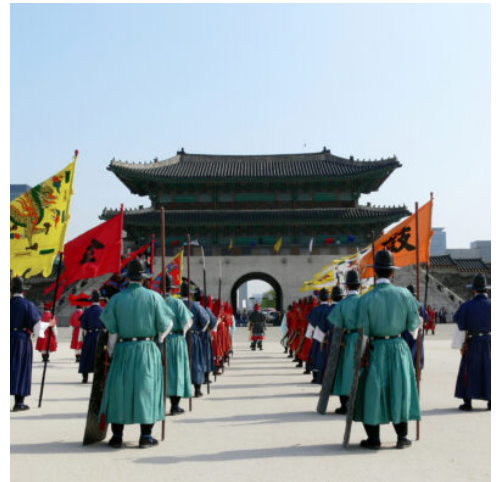
Gyeongbok Palast, Seoul

Bei Ihrer Ankunft am Flughafen von Seoul werden Sie von Ihrer Reiseleitung begrüßt. Bereits auf dem Weg zu Ihrem Hotel erwartet Sie ein Einblick in das traditionelle Südkorea. Einst Heimat der Aristokratie, begeistert das Viertel Bukchon Hanok mit historischer Architektur. Bonsai-Pinien, verzierte Mauern und hölzerne Tore erinnern an die altherwürdige Handwerkskunst und die Geschichte des Viertels, die über 600 Jahre in die Vergangenheit reicht.