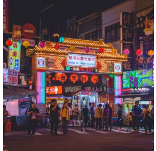
Der Raohe-Nachtmarkt in Taipeh

Der Gesang der Mönche füllt die Morgenluft und lädt dazu ein, an der morgendlichen Andacht teilzunehmen. Nach dem Frühstück fahren Sie weiter in die nahe Hafenstadt Kaohsiung. Zwischen den modernen Hochhausfassaden begrüßen Sie der schöne Frühlings- und der Herbstpavillon, die mit ihrer kunstvollen Architektur und ihrer idyllischen Lage im Lotussee bezaubern. Leuchtend bunt präsentieren sich die Tempel Kaohsiungs, allen voran die fantastische Drachen- und Tiger-Pagode, deren Mäuler als Eingang ins Innere der Pagode dienen. Nach diesen Impressionen erwartet Sie am Ufer des Flusses Chihpen ein ganz besonderes Erlebnis, denn heiße Quellen laden hier zum Erholen und Entspannen ein. (F)