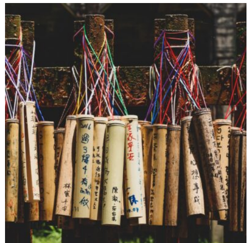
Gute Wünsche auf Bambus geschrieben

Vormittags besuchen Sie die King Car Kavalan Whisky Destillerie, einer der wichtigsten des Landes. Nach dem Besuch des National Cneter for Traditiona Arts fahren Sie nach Taipeh. Rest des Tages zur Verfügung. (F)