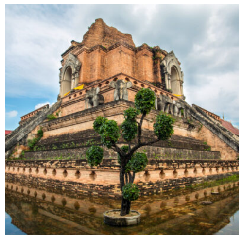
Wat Chedi Luang in Chiang Mai

Der heutige Tag steht Ihnen für eigene Erkundungen zur freien Verfügung. Für Naturliebhaber lohnt sich z.B. ein Ausflug in den Doi Inthanon-Nationalpark, gepaart mit dem Besuch von Bergvölkern. Die herrlichen Landschaften, die gigantischen Wasserfälle und die tollen Möglichkeiten für Wanderungen machen den Nationalpark zu einem besonderen Ort für Naturliebhaber. Nutzen Sie auch die Gelegenheit, um sich am Abend durch die charmante Stadt treiben zu lassen und nordthailändisches Essen zu genießen. (F)