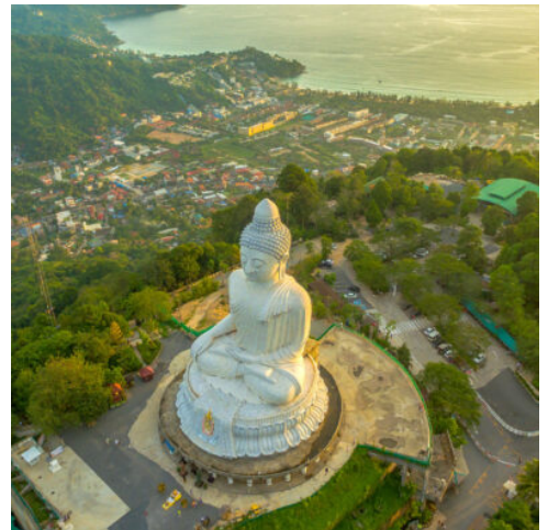
Big Buddha Wahrzeichen der Insel Phuket