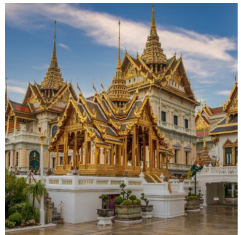
Bangkok Grand Palace

Gestalten Sie den Tag ganz nach Ihren eigenen Vorstellungen. Erkunden Sie weitere Viertel und Sehenswürdigkeiten der quirligen Metropole. Wie wäre es mit einem Abstecher nach Chinatown? Dieser Ort ist ein wahres Erlebnis und fasziniert seine Besucher durch seinen Trubel, die bunten Lichter, die kräftigen Farben, die hübschen chinesischen Tempeln und das vielseitige Angebot an Streetfood. Oder Sie machen eine entspannte Tour durch Thonburi? Dieser Teil der Stadt ist am Westufer des Chao Phraya gelegen und älter als die Metropole selbst. Thonburi war schon eine kleine Stadt, als Bangkok noch ein Hüttendorf war. Der bis heute weitgehend authentisch gebliebene Stadtteil ist in jedem Fall einen Besuch wert. (F)