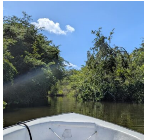
Bootstour nach Lamanai

Heute überqueren Sie die Grenze nach Belize und unternehmen eine spannende Bootstour zur Maya-Stätte Lamanai. Die Fahrt durch Flüsse und Dschungel ist ein echtes Abenteuer. In Lamanai erwarten Sie Tempel, die aus dem Wald herausragen, und faszinierende Geschichten. Ihre Unterkunft ist direkt am Fluss gelegen. Genießen Sie die Ruhe und die exotische Umgebung. (F)