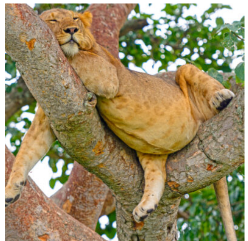
Löwe im Queen Elizabeth Nationalpark

Der heutige Tag beginnt bereits sehr früh, um sich auf das bevorstehende Gorilla-Trekking (optional, siehe Wunschleistungen) vorzubereiten. Das Trekking der Berggorillas ist eine der aufregendsten Tierbegegnungen auf der Erde. Die Wanderung dauert zwischen 2 und 6 Stunden, ist aber die Anstrengung absolut wert. Sie werden von einem erfahrenen Ranger begleitet, der Ihnen interessante Fakten über Flora, Fauna und den Lebensstil der Gorillas erzählen wird. (F M A)