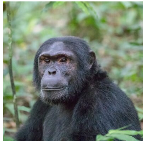
Schimppanse im Kibale Nationalpark

Erleben Sie eine aufregende Safari am frühen Morgen im Queen Elizabeth Nationalpark. Nachmittags genießen Sie eine unvergessliche Bootsfahrt auf dem Kazinga-Kanal. Während dieser malerischen Fahrt haben Sie die Möglichkeit, die reiche Tierwelt und die atemberaubende Landschaft des Parks aus einer völlig neuen Perspektive zu erleben. Der Kazinga-Kanal ist ein natürlicher Wasserweg, der den Lake Edward mit dem Lake George verbindet. Während der Bootsfahrt gleiten Sie langsam entlang des Kanals und können dabei Hunderte von Flusspferden beobachten, die sich im Wasser oder am Ufer sonnen. Neben den Flusspferden gibt es auch eine Vielzahl von Vogelarten und andere Tiere wie Elefanten, Büffel, Krokodile und verschiedene Antilopenarten zu sehen. (F M A)