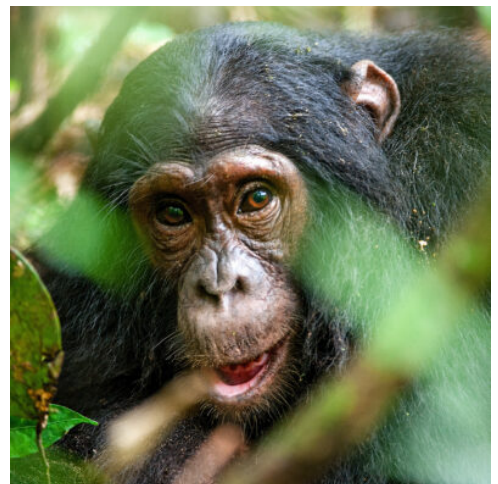
Schimpanse in ihre natürliche Umgebung

Noch vor dem Frühstück und vor dem Flug am Abend, heißt es am heutigen Morgen, sich mit einer geführten Fußsirsch noch einmal in Bewegung zu setzen und die umgebende Tierwelt aus einer völlig anderen Perspektive kennenzulernen. Nach diesen morgendlichen Impressionen genießen Sie Ihr verdientes Frühstück. Danach heißt es dann, Abschied nehmen. Mit unvergesslichen Eindrücken im Gepäck fahren Sie dorthin, wo Ihre Ugandareise begonnen hat, nach Entebbe. Auf dem Weg dorthin passieren Sie erneut den Äquator. In Entebbe angekommen, unternehmen Sie eine kleine Kreuzfahrt bei Sonnenuntergang auf dem Viktoriasee – was für ein schöner Moment zum Abschied! Anschließend fahren Sie zum Flughafen. Kurz nach Mitternacht Rückflug nach Deutschland. (F)