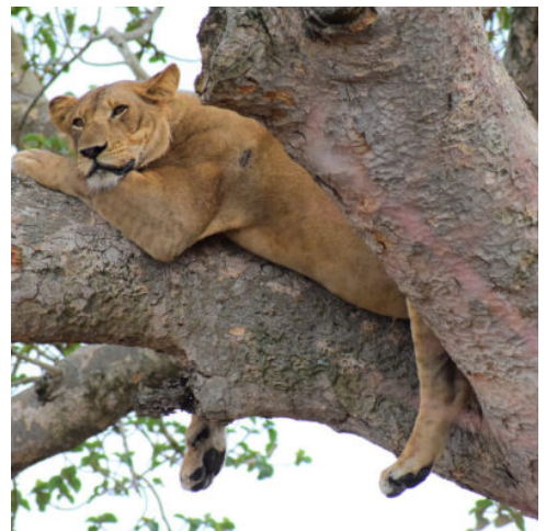
Baumlöwen in Uganda

Eine weitere Pirschfahrt am Morgen bietet mit etwas Glück herrliche Ausblicke. Zahlreiche Säugetierarten leben im Queen Elizabeth-Nationalpark und die Landschaft besticht mit einer wahren Vielfalt. Sie treffen auf offene Savanne, grünen Regenwald, dichte Papyrussümpfe, Kraterseen und den unglaublich weiten Lake Edward. Am Nachmittag unternehmen Sie eine traumhafte Bootsfahrt auf dem Kazinga-Kanal, an dessen Ufern sich die Tiere bei ihrem abendlichen Bad beobachten lassen. (F M A)