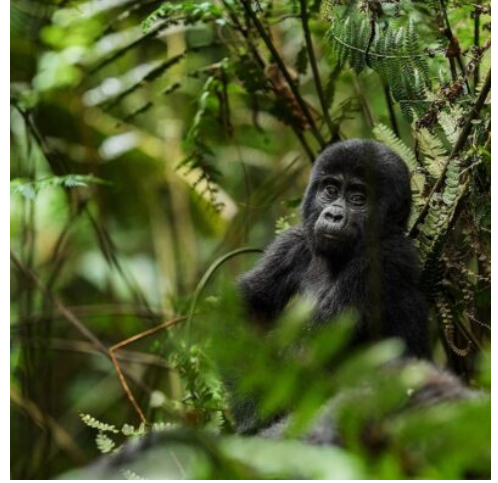
Uganda - die Heimat der Berggorillas

An diesem Morgen klingelt der Wecker früh, damit Sie ein absolutes Highlight dieser Reise nicht verpassen: Gorillas in freier Wildbahn einmal hautnah zu erleben. Das Gorilla-Trekking zählt wohl zu den aufregendsten Wildtier-Erfahrungen, die man machen kann. Fast die Hälfte der gesamten Berggorillas lebt hier im Bwindi-Nationalpark. Keine Sorge, ein erfahrener Park-Ranger wird Sie zu den Gorillas führen und Ihnen allerlei Wissenswertes über Flora und Fauna und die Lebensweise der Gorillas zu berichten wissen. (Gorilla Trekking Genehmigung optional). Alternativ zum Gorilla-Trekking bieten sich mehrere Wanderungen an, die Sie unternehmen können. (F M A)