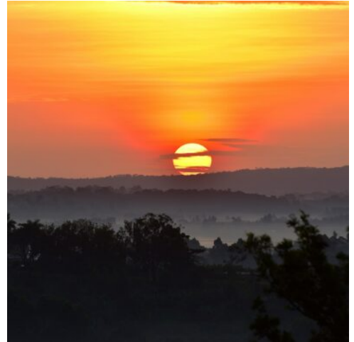
Sonnenaufgang in Kibale

Mit dem Geländefahrzeug geht es heute nach Fort Portal, Ihrem Ausgangspunkt zum Kibale-Nationalpark. Auf dem Weg dorthin verwöhnen zahlreiche, sattgrüne Teeplantagen Ihr Auge, welche die vorüberziehende Landschaft zieren. Am Nachmittag empfängt Sie dann Ihre Unterkunft. (F M A)