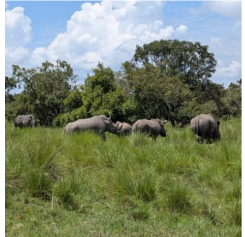
Ziwa Rhino Sanctuary

Nach dem Frühstück starten Sie Ihre Tour in Kampala und machen sich auf den Weg zum Ziwa Rhino Sanctuary. Hier unternehmen Sie eine Wandersafari zu den Südlichen Breitmaulnashörnern, die erfolgreich in Uganda wieder angesiedelt wurden. Am Nachmittag geht es weiter zu den beeindruckenden Murchison Falls, nach denen der Nationalpark benannt ist. (F A)