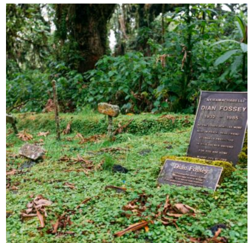
Grab der Gorillaforscherin Dian Fossey

Nach dem Frühstück fahren Sie in den südlichen Teil des Queen Elizabeth Nationalparks, nach Ishasha. Hier erleben Sie die faszinierende afrikanische Tierwelt in einer unvergleichlichen Landschaft. Bei einer Wildbeobachtungsfahrt haben Sie die einzigartige Gelegenheit, die berühmten baumkletternden Löwen zu entdecken. Im Gegensatz zu den meisten anderen Löwenpopulationen, die hauptsächlich auf dem Boden leben, haben sich diese Löwen an die Baumkronen angepasst. Mit etwas Glück können Sie die Löwen dabei beobachten, wie sie auf Ästen in den Bäumen ruhen oder sich von dort aus auf die Jagd begeben. (F A)