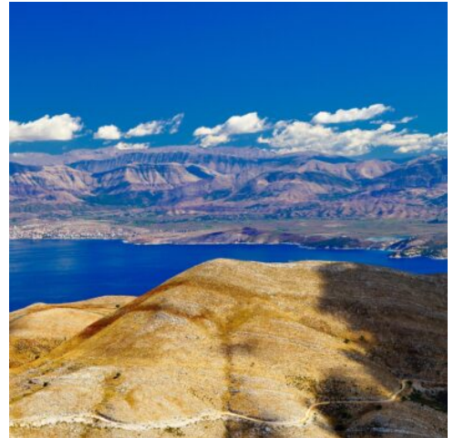
Blick von Korfu

Lassen Sie die Seele baumeln und genießen Sie freie Tage am Strand. (F A)