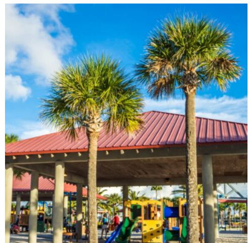
Clearwater Beach, Florida

Sie verlassen heute den Big Apple und fliegen weiter in den Süden in Florida. Das im Südosten der USA gelegene Florida mit seinen Küsten am Atlantischen Ozean und am Golf von Mexiko birgt viele Überraschungen: von Traumstränden zu sensationellen Naturdenkmälern, erstklassigen Kulturattraktionen und kaum bekannten Schätzen. Ihr erstes Ziel ist die Stadt Orlando, ein farbenfrohes Vergnügungsmekka aus Freizeit- und Themenparks. Hier werden Sie durch Ihre neue Reiseleitung begrüßt und es erfolgt der Transfer zu Ihrem Hotel. (F)