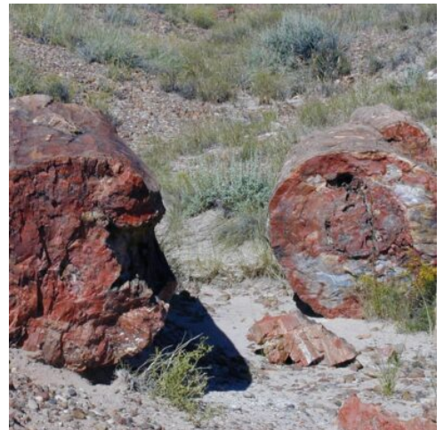
Petrified Forest National Park

Entdecken Sie Gallup mit seiner reichen indianischen Kultur und den zahlreichen Kunstgalerien. Weiter geht es zum Petrified Forest National Park, einem einzigartigen Naturwunder. Hier haben sich Baumstämme über Jahrmillionen in versteinertes Holz verwandelt, da Silizium zu Quarz kristallisierte und die Bäume so konserviert wurden. Im Park befindet sich auch die Painted Desert – eine weite, trockene Badlands-Landschaft mit markanten Buttes und Mesas, die mit ihren bunten Farben beeindruckt.