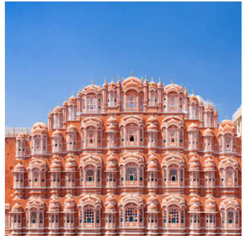
Hawa Mahal Palace

Nach dem Frühstück Fahrt zum Flughafen für Ihren Flug nach Guwahati, dem Tor zu Assam. Checken Sie auf Ihrem Pandaw-Schiff „RV Kindat Pandaw“ ein, treffen Sie Ihre Crew für die nächsten 7 Nächte und setzen Sie die Segel stromaufwärts auf dem mächtigen Brahmaputra Fluss. (F M A)