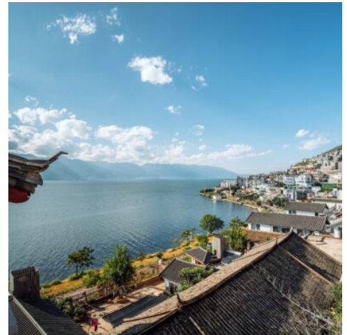
Dali Altstadt und Erhai-See

Heute besuchen Sie das Dorf Tuanshan, welches ein gut erhaltenes, historisches Dorf ist und auf eine lange Geschichte zurückblickt. Es ist berühmt für seine traditionelle chinesische Architektur und seine einzigartigen ländlichen Bräuche. Bei einem Spaziergang durch das Dorf lässt sich die schlichte und ruhige Atmosphäre des Landlebens hautnah erleben. Nach der Besichtigung setzen Sie die Reise fort und fahren weiter nach Yuanyang. Dieser Ort ist weltweit berühmt für seine spektakulären Reisterrassen – ein Meisterwerk des harmonischen Zusammenwirkens von Mensch und Natur. Die Terrassen erstrecken sich schier endlos und bieten je nach Jahreszeit immer wieder neue, wunderschöne Anblicke. Zudem ist Yuanyang ein hervorragender Ort, um die Kulturen der dort ansässigen ethnischen Minderheiten kennenzulernen. Nach der Ankunft in Yuanyang checken Sie zunächst im Hotel ein und genießen anschließend das Abendessen in einem lokalen Restaurant. (F A)