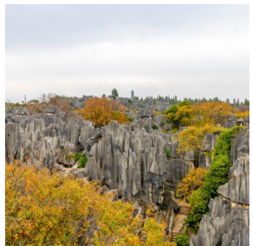
Steinwald in Yunnan

Sie verlassen Chengdu in Richtung Kunming mit dem Hochgeschwindigkeitszug. Erleben Sie die moderne Art in China zu reisen und genießen Sie die wunderschöne Landschaft, die an Ihnen auf dem Weg in den Süd-Westen vorbeizieht. Ankunft im Hotel und Abendessen. (F A)