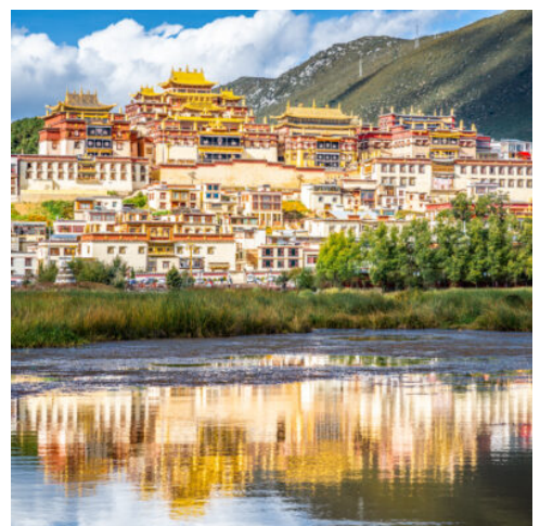
Kloster Ganden Sumtseling

Nach dem Frühstück im Hotel setzen Sie Ihre Reise zur Altstadt von Shaxi fort. Shaxi ist eine hervorragend erhaltene, historische Marktstadt an der alten Tee-Pferde-Straße. Sie besticht durch ihre ursprünglichen Gassen, traditionellen Häuser und die ruhige, ländliche Umgebung. Die Stadt bewahrt sich einen schlichten Lebensstil sowie ein tiefgreifendes historisches und kulturelles Erbe. Anschließend besuchen Sie die örtlichen Buddha-Grotten. Diese Grotten beherbergen exquisite, jahrhundertealte Steinschnitzereien und buddhistische Statuen. Es handelt sich um ein kostbares Kulturdenkmal von hohem religiösem und künstlerischem Wert. Die stille Berglandschaft schafft eine feierliche und friedvolle, künstlerische Atmosphäre. Nach den Besichtigungen checken Sie im Hotel ein, um sich kurz auszuruhen. Am Abend genießen Sie das Abendessen in einem typischen lokalen Restaurant. Hier können Sie authentische Spezialitäten aus Yunnan sowie einzigartige Zutaten aus den umliegenden Bergen kosten. (F A)