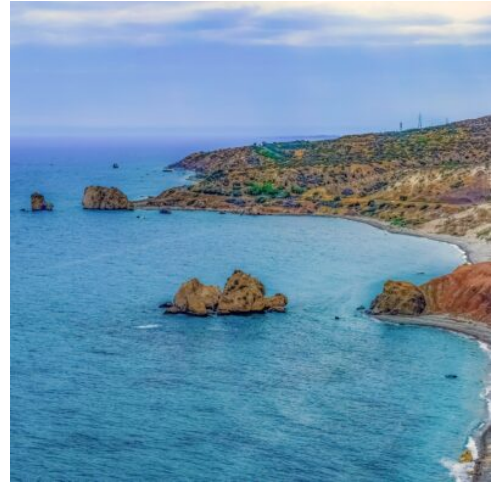
Petra tou Romiou

Der heutige Ausflug führt auf der Küstenstrasse durch die schönen Obstplantagen und Zypressenalleen von Fassouri bis zu der archäologischen Ausgrabungsstätte des antiken Stadtkönigtums Kourion. Hier besuchen Sie das Theater aus römischer Zeit und die schönen Bodenmosaiken und Bäder im Haus des Eustolios Weiter zum Dorf Yieroskopou, dem sogenannten "Heiligen Garten" der Göttin Aphrodite, Ausgangspunkt der Pilgerstrasse zum Aphroditeheiligtum. Hier besuchen Sie, die aus dem 9. Jahrhundert stammende, Fünfkuppelkirche der Ayia Paraskevi, mit ihrer eindrucksvollen byzantinischen Architektur. Anschließend entdecken Sie die Stadt Pafos, die in der Antike sechs Jahrhunderte lang Inselhauptstadt war und mit ihrer 2000 Jahre alten Geschichte heute zum UNESCO Weltkulturerbe gehört. Weiter zum malerischen Hafen von Pafos. Dort werden Legenden der griechischen Mythologie bei der Besichtigung der prächtigen römischen Mosaiken in den Häusern des Dionyssos und des Aions und in der Theseus-Villa lebendig. Anschließend verlassen Sie die Stadt Pafos und erreichen einen atemberaubenden Küstenabschnitt mit dem Aphrodite-Felsen, Petra tou Romiou genannt, wo laut der griechischen Saga Aphrodite, die Göttin der Liebe und Schönheit, aus dem Meeresschaum geboren wurde. Genießen Sie den reizvollen Blick! Ein Foto ist sicherlich unerlässlich. (F A)